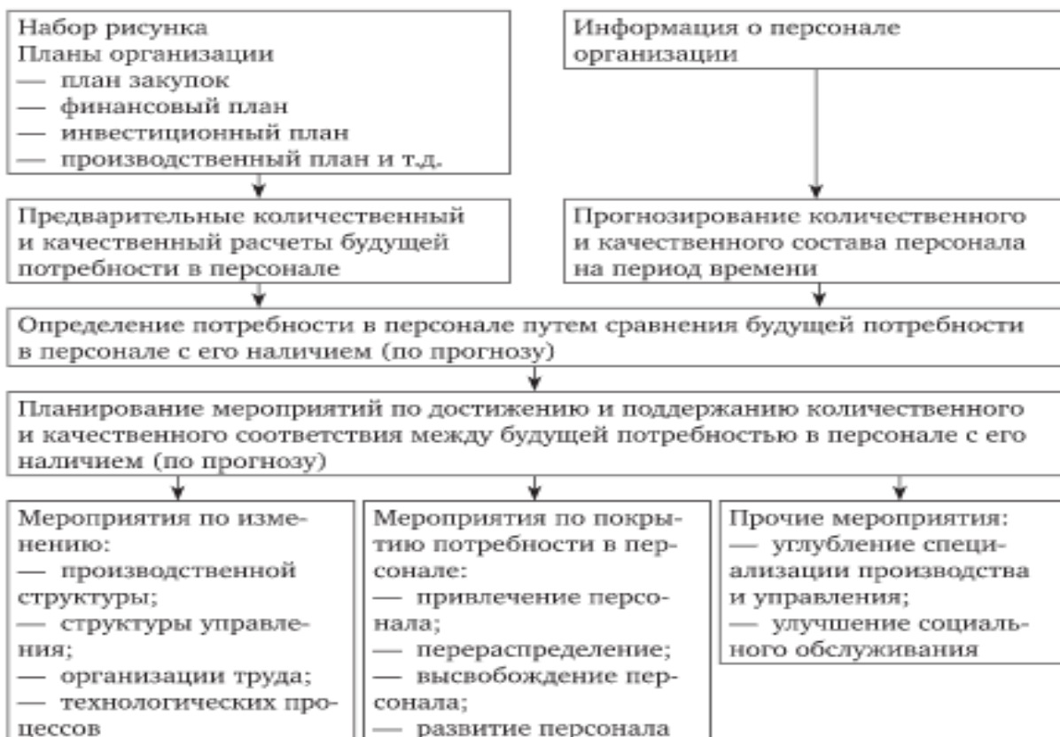
Рис. 2 – Планирование потребности в персонале образовательного учреждения