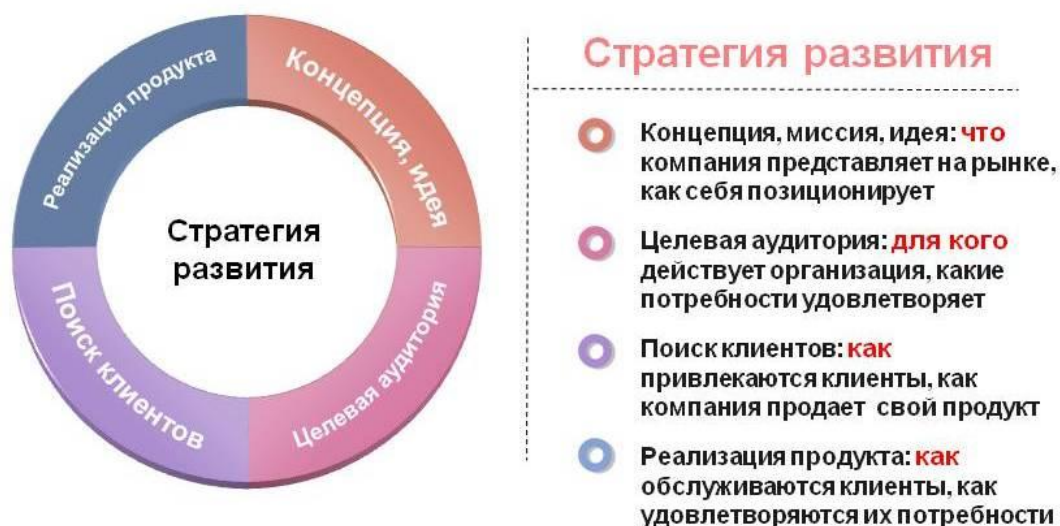
Рис. 2 – Направления общей стратегии управления персоналом образовательного учреждения на пятилетний период

Постановка задачи: Разработайте организационно-экономические мероприятия, реализация которых позволит достичь долгосрочные цели по направлениям деятельности службы управления образовательного учреждения: обеспечение персоналом, реализация трудового потенциала, развитие трудового потенциала (таблица 3).